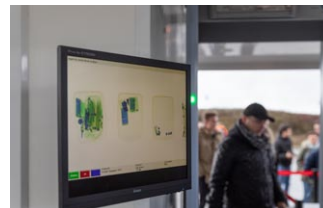
Scanner bagages Rayon X