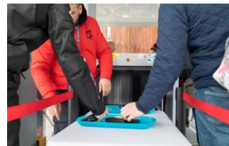
Bonne acceptabilité du public