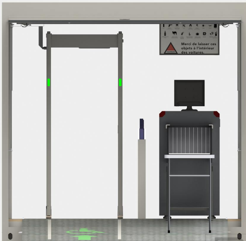
Fig.1 Illustration 3D - Vue côté entrée module déployé

Tous droits réservés - Produit breveté n° 1756837 et n° 1915780 Marque déposée au nom de BEHM