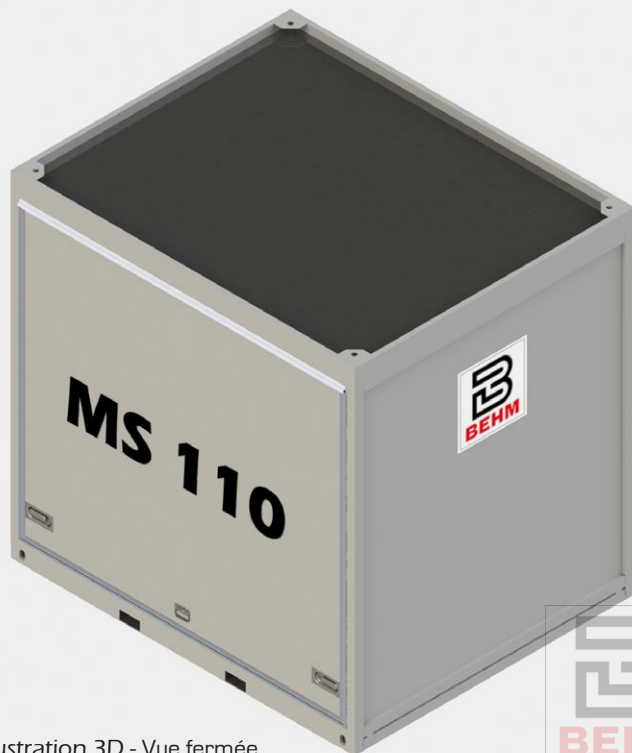
Fig.6 Illustration 3D - Vue fermée