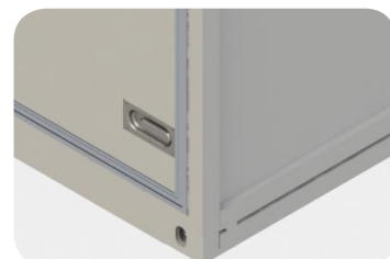
Fig.7 Poignée de verrouillage