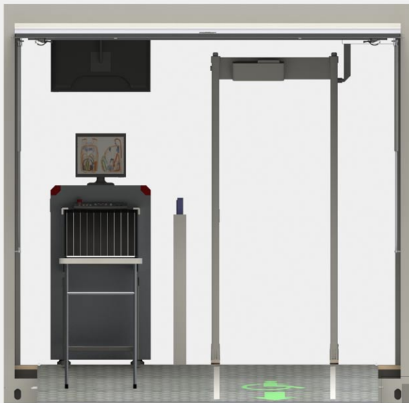
Fig.5 Illustration 3D - Vue côté sortie