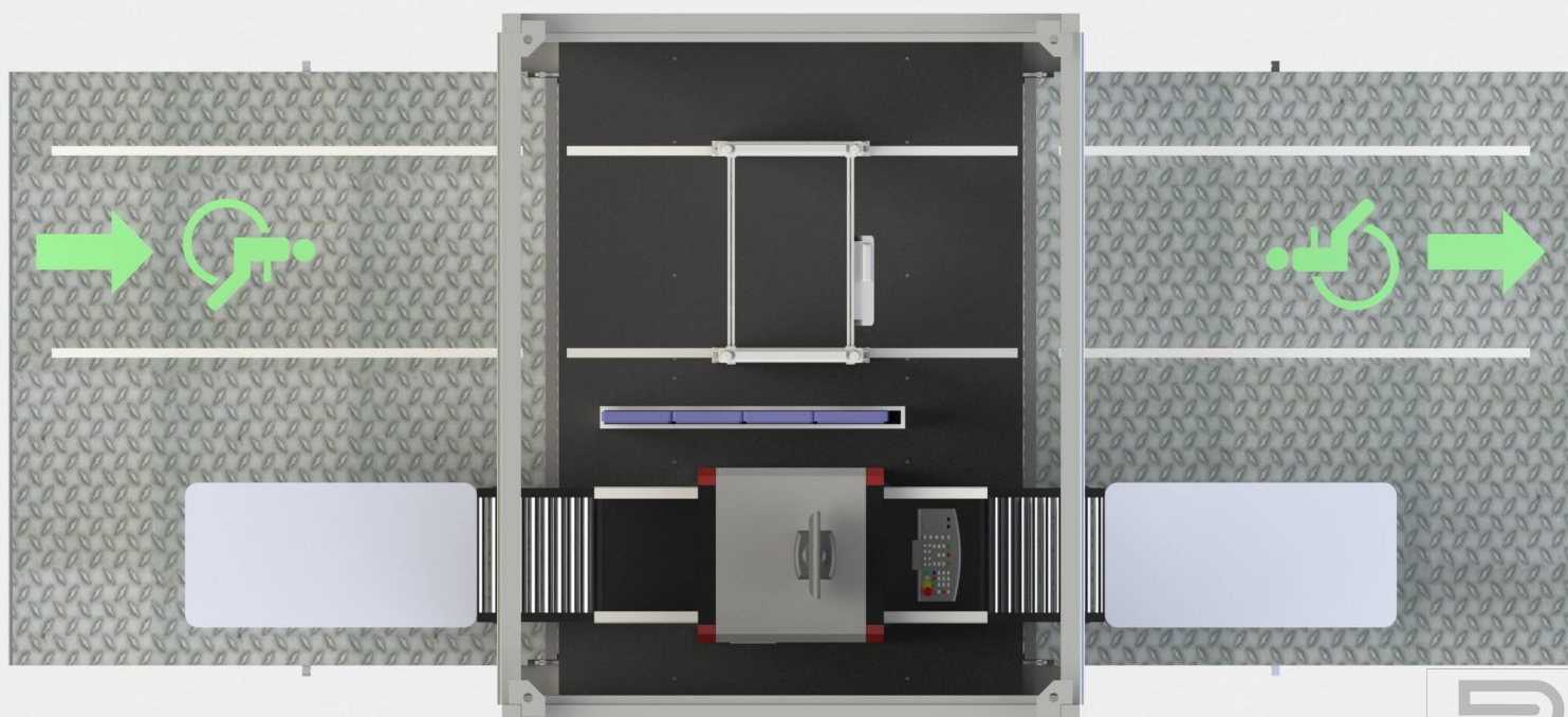
Fig.4 Illustration 3D - Vue de dessus module déployé