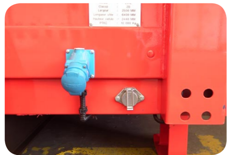
PRISE 24 V 15 BROCHES (METAL) ALIMENTATION PAR PORTEUR PRISE DS1 (BLEU)