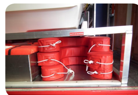
BOUEES DE SAUVETAGE