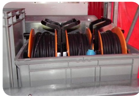
DÉVIDOIR ÉLECTRIQUE DE 10M DS1-DS1