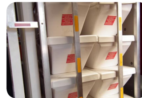
8 BANQUETTES COFFRES 1 LAMPE TORCHE 2 ECOPEES 1 CORNE DE BRUME 1 GAFFE ALU TELESCOPIQUE 1 BOUT D AMMARRAGE (2*5) 1 EXTINCTEUR POUFRE1 KG 1MOUILLAGE GRIP 5.5KG COMPLET 1 FILIN 40M POUR BOUÉE 3 BRASSIÈRES 150N