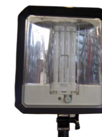
PROJECTEUR A LUMIERE FROIDE PORTATIF SUR TREPIED