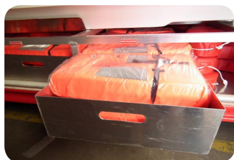
GILETS DE SAUVETAGE