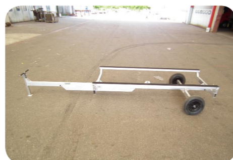
Chariot de mise à l'eau CHARGE UITLE 200KG