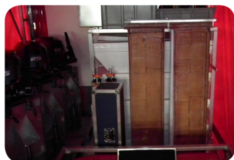
4 BANQUETTES SIMPLES