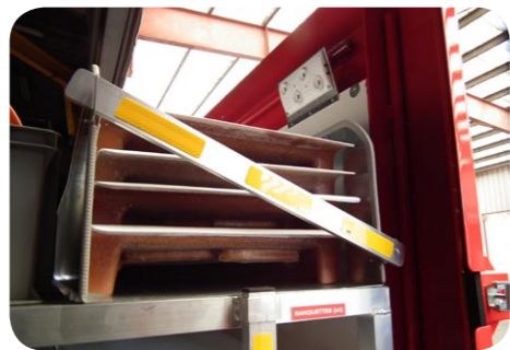
4 BANQUETTES SIMPLES