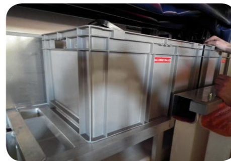
2 CAISSES iso 600*400*320 8 HELICES DE RECHANGE 2 RALONGES DE 20M TYPE DS1 1 RALLONGES DE 10 M 2 PROJECTEURS PORTATIFS