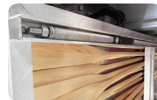
BARRE D' ECARTEMENT